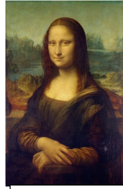
La Gioconda, Da Vinci

...des traditions, des richesses... Tout un art de vivre.