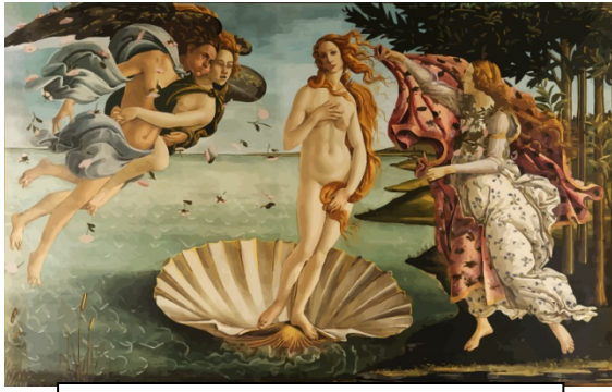
La Naissance de Vénus, Botticelli