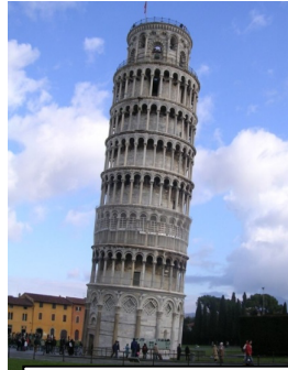
Torre di Pisa