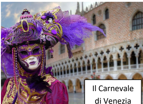
Il Carnevale di Venezia