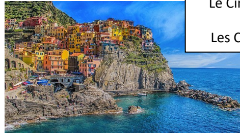
Le Cinque Terre